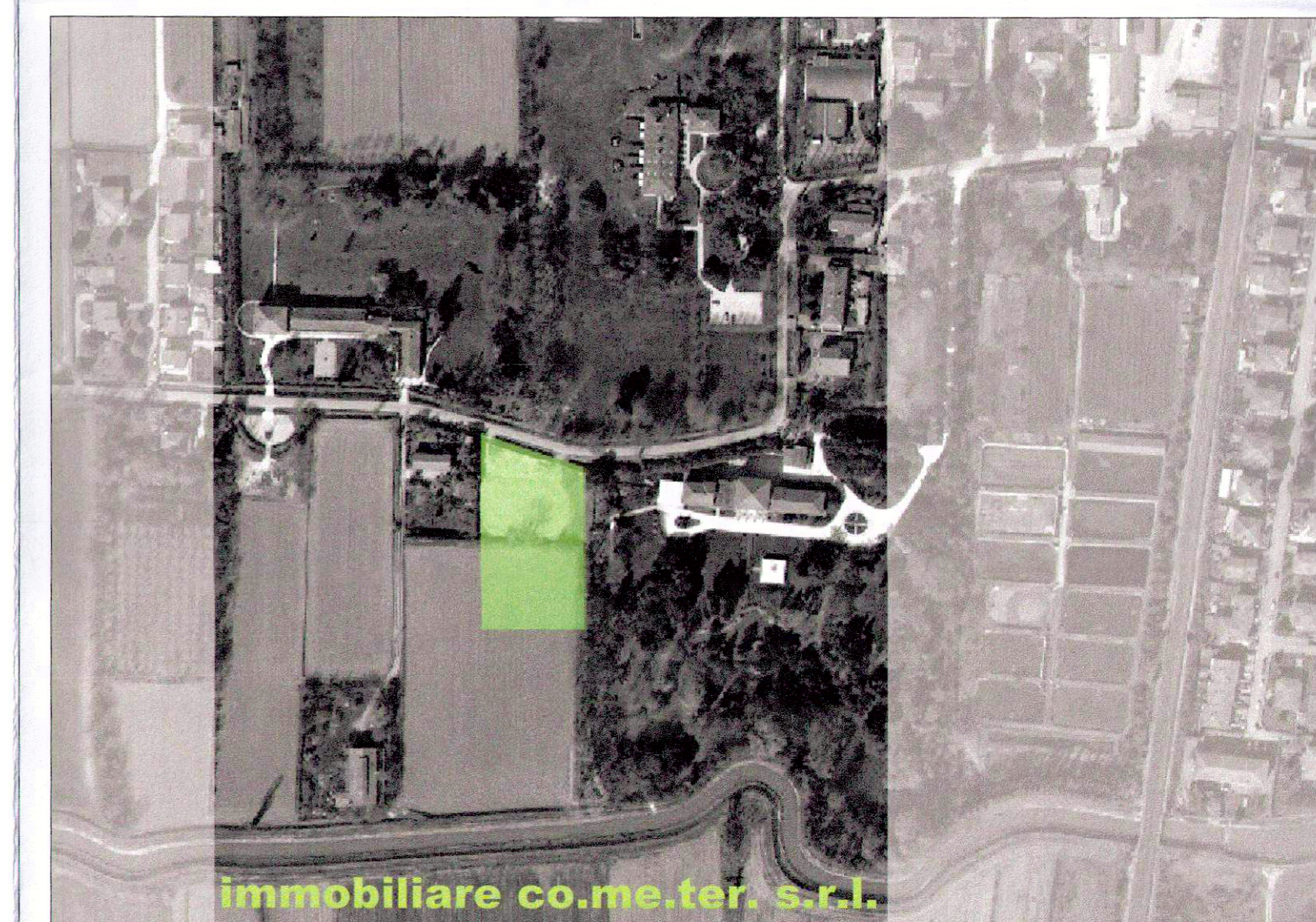
scala 1/50 1/100 1/200